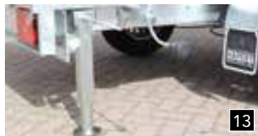
13 Kurbel-stützen, 90° drehbar und verstellbar