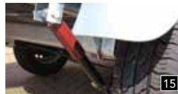
15 Stoßdämpfer incl. Halterung auf der Achse montiert