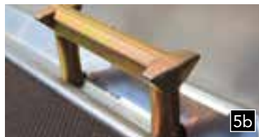
5b Verzurrsystem im Seitenrahmen integriert (TUV-geprüft)