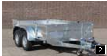
2 Ausführung mit Stahl-Bordwände