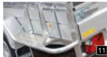
11 Abschirmbügel vorne- oben und hinten die Kotflügel