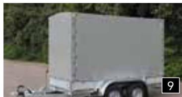
9 Plane und Gestell 1500 / 1800 mm. hoch