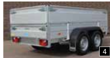
4 Aufsatz-bordwände in aluminium 400 mm. hoch