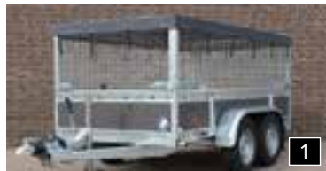
1 Seitenwände in Anthrazit (Option) und Ladungnetz (Option)