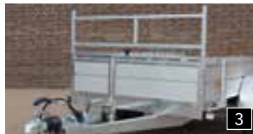
3 Hohes Frontgitter montiert