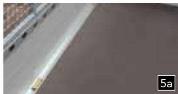
5a Verzurrsystem im Seitenrahmen integriert (TUV-geprüft)