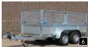
6 Wellgitter-Aufsatz 750 mm, abnehmbar