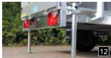
12 Stützen mit Halter