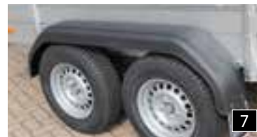
7 Kunststoff Kotflügel